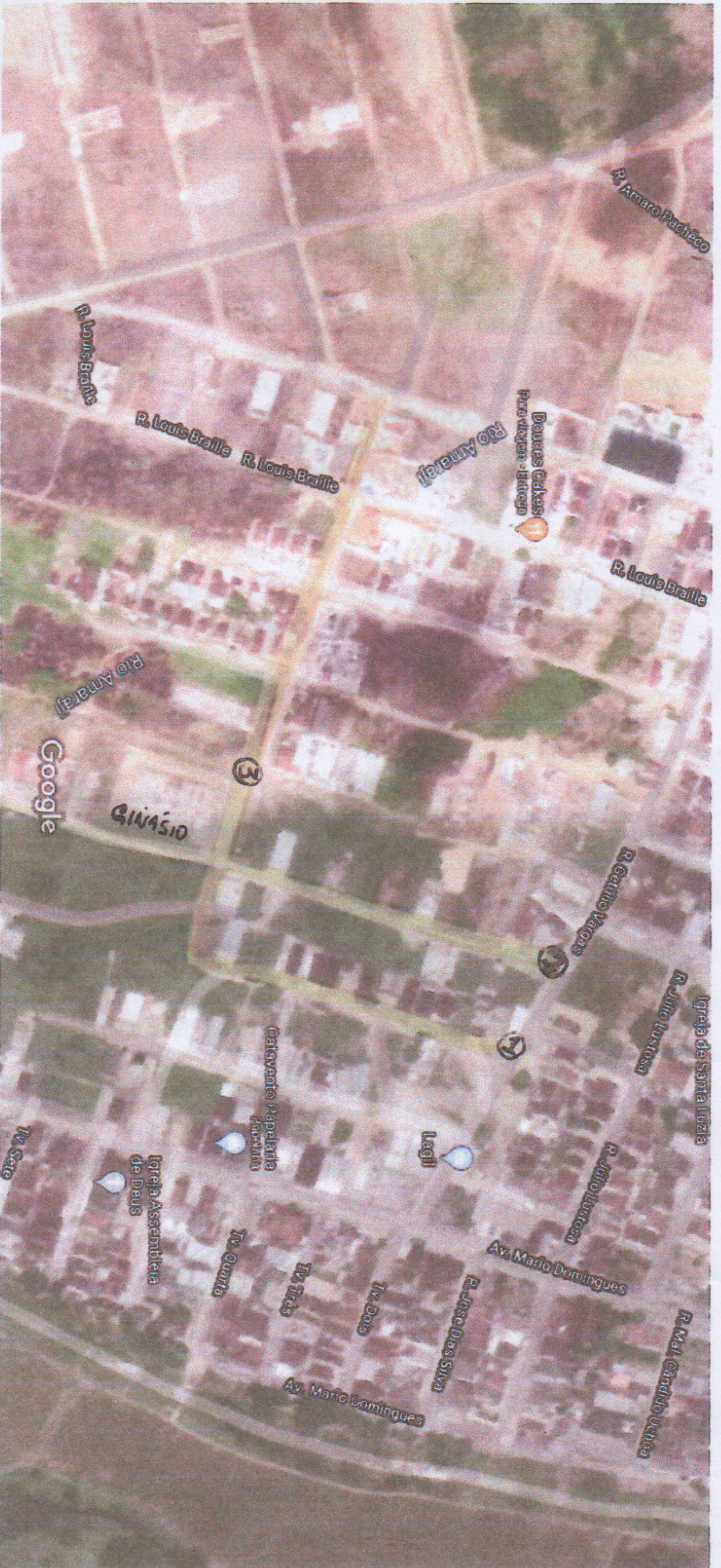
Imagens ©2020 CNES / Airbus, Maxar Technologies, Dados do mapa ©2020 50 m